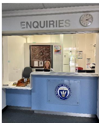
У каждого входа находятся стойки для справок посетителей

У каждого входа есть стойки с информацией для посетителей. Вы можете спросить о направлении движения у сотрудников или волонтеров. У каждого входа также есть электронные табло, которые помогут вам сориентироваться. Информация доступна на вашем языке.