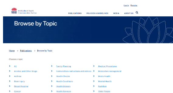
NSW Multicultural Health и Справочник переводных материалов

Вы также можете найти достоверную переведенную медицинскую информацию на этих веб-сайтах. Нажмите на картинку, и вы попадете на веб-сайт.